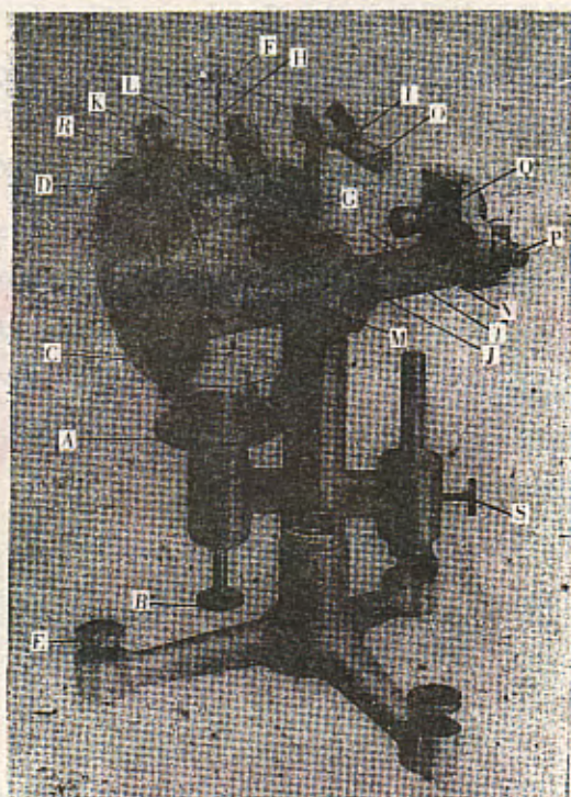
A—样品座; B—样品座螺丝; C—刻度盘; D—游标; E—水平螺旋; F—臂1; G—臂2; H—臂3; I—调节臂的螺母; J—臂的制止器(1); K—臂的制止器(2); L—指针; M—蜗轮把手; N—钢丝; O—游码; P—微调蜗轮把手; Q—固定钢丝 字母; R—放大镜; S—样品座的制止器; T—水准泡