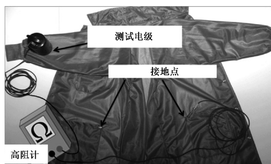
图 A.1 具有接地点的防静电服点对点电阻测试示意图