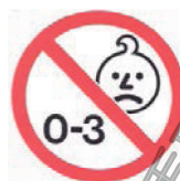
图 A.1 年龄警告的图标

对 36 个月以下儿童可能构成危险的玩具应附警告,例如:“警告:不适合 36 个月以下儿童使用”或“警告:不适合 3 岁以下儿童使用”或采用图 A.1 图标。